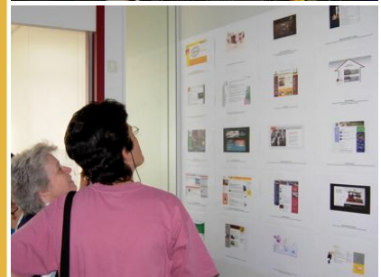
photos : 8 septembre 2006 à Aubonne, 10 ans d'activité Internet pour Megaphone